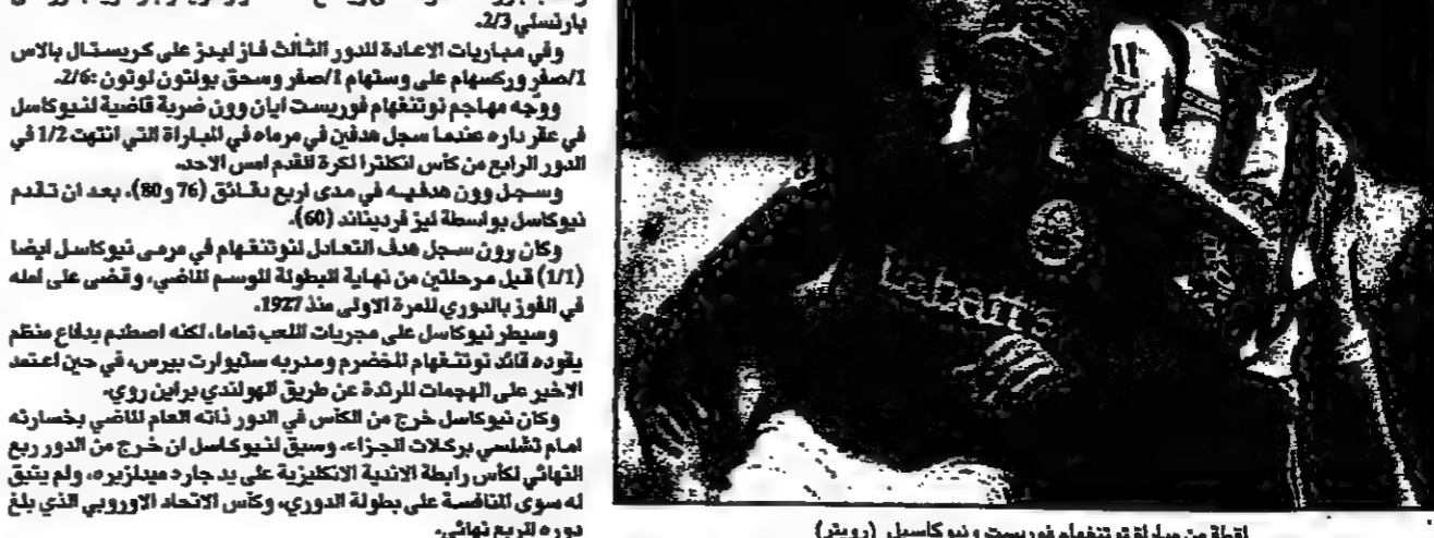
لعبت من مباراة نوتنغهام فوريست ونيوكاسل

لندن - من مايك كرايلى: سجل نادي وولف كينغ مفاجئاً لا يتسنى في تاريخ انجازاته بتغلبه على فريق نيوكاسل في الدور الرابع لكأس الاتحاد الانكليزي لكرة القدم.